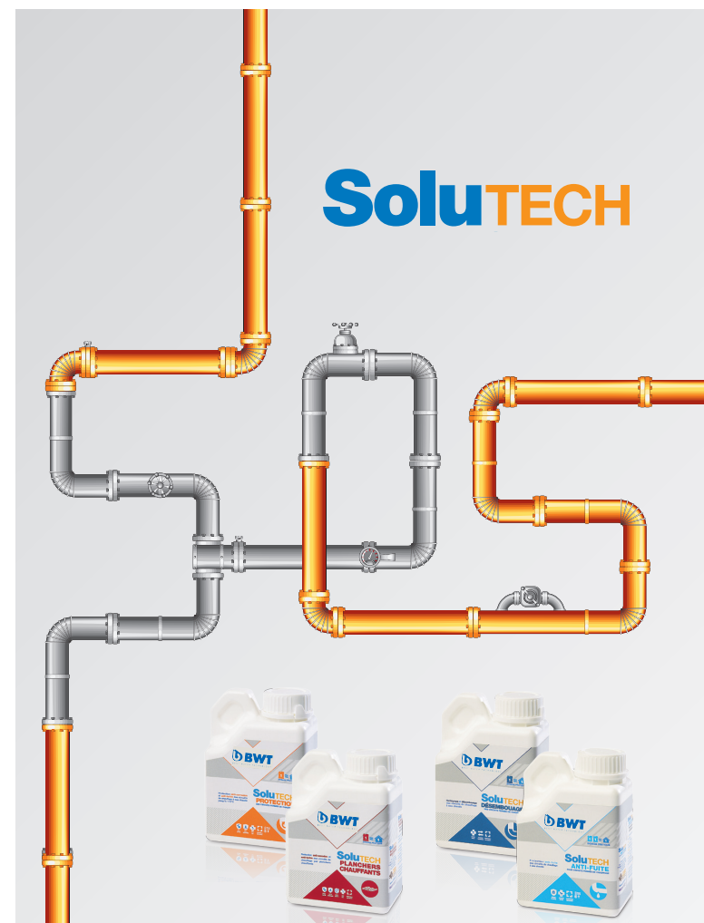
Négy termék a fűtési rendszer védelmére

Mottónk – BWT – For You and Planet Blue – azt az igényünket közvetíti, hogy környezeti, gazdasági és társadalmi felelősséget vállaljunk. Vevőinknek a legjobb termékeket, berendezéseket, technológiákat és szolgáltatásokat nyújtunk a vízkezelés minden felhasználási területén és ezzel egyidejűleg hozzájárulunk a bolygónk erőforrásainak kíméletes hasznosításához.